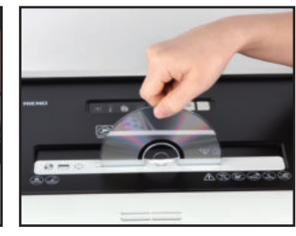
6. CD/카드를 투입합니다. 1회 1매씩 넣어주세요.