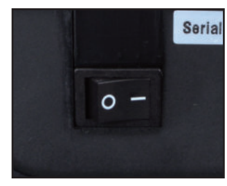
1. 기기 뒷편의 전원스위치를 켜 주세요. 2. 기기 윗쪽의 전원버튼을 누르면