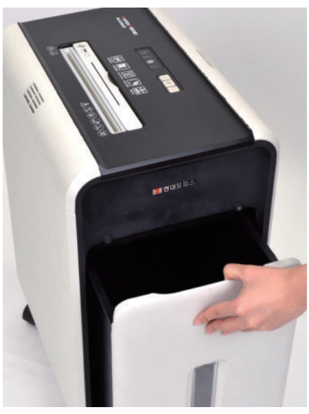
1. 파지함을 꺼내주세요.