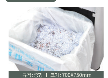
* 정전기 발생을 최소화하여 파지의 흩날림을 예방합니다. * 분리수거에 용이하며 손쉽게 파지를 버릴 수 있습니다.