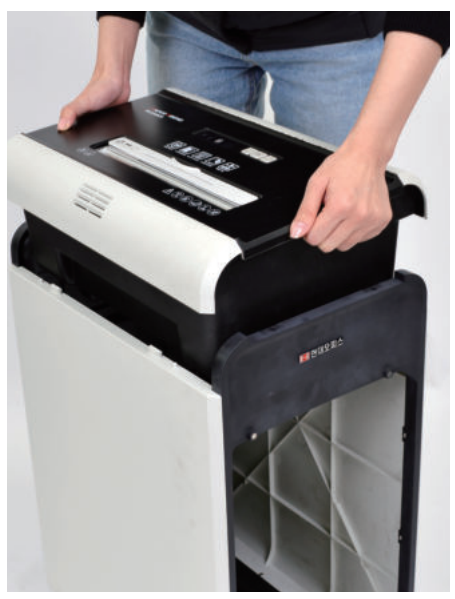
3. 세단기의 헤드와 몸통이 분리된 모습입니다.