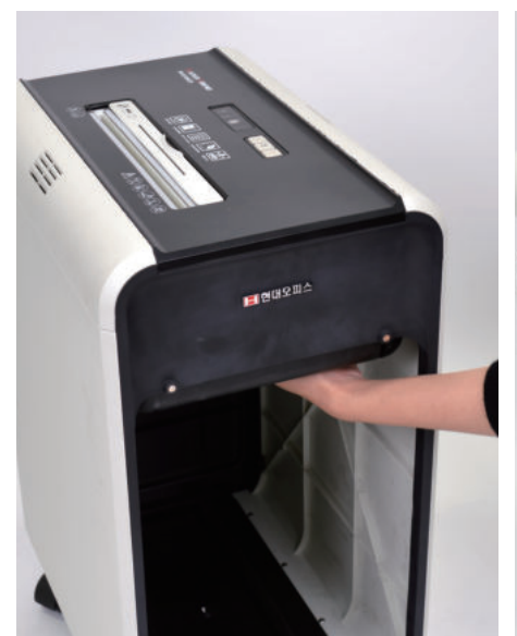
2. 파지함이 있던 안쪽 윗부분에 양 손바닥을 놓고 힘을 주어 윗쪽으로 세게 밀어줍니다.